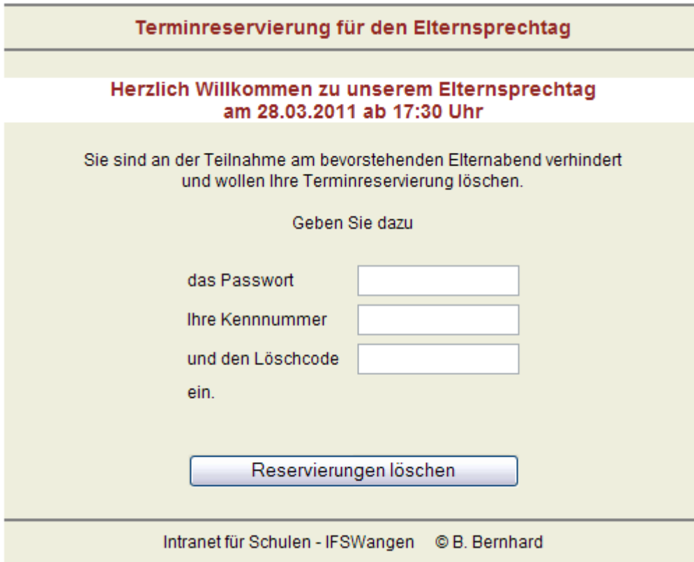
Abb. 5 - Löschseite für die Eltern

Der Eintrag des Links von Abb.4 in der Adresszeile des Internet-Browsers ruft die Löschseite für die Eltern auf.